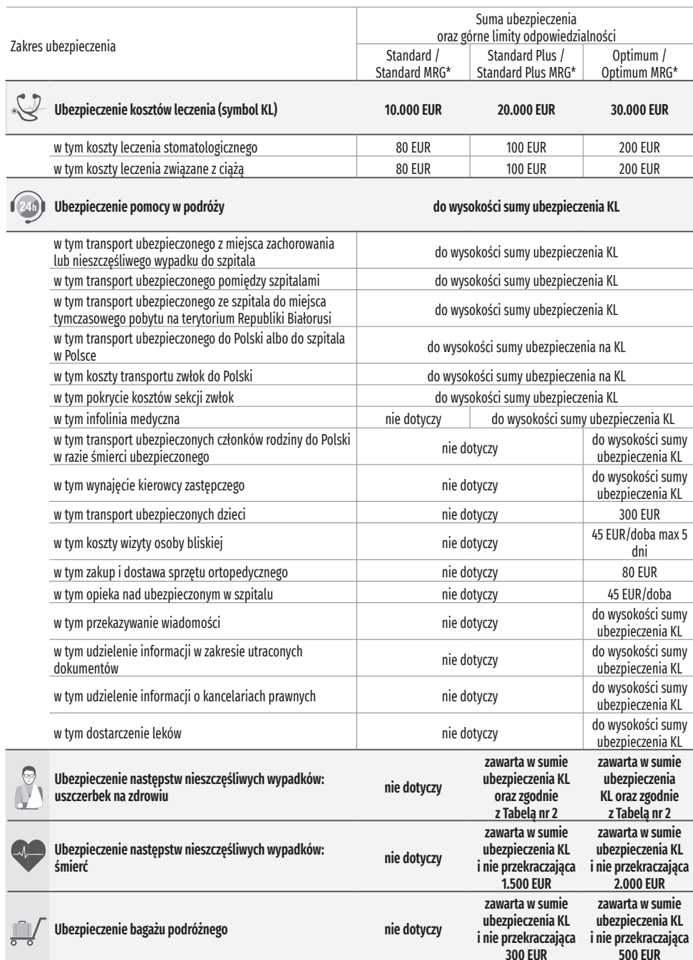
➤ Tabela nr 1